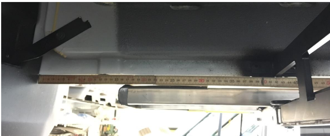
Bild 3. Placering av fotsteg i längdled.

Montera buntband eller tvingar på alla konsolerna så de låses i utfällt läge, se bild för exempel.