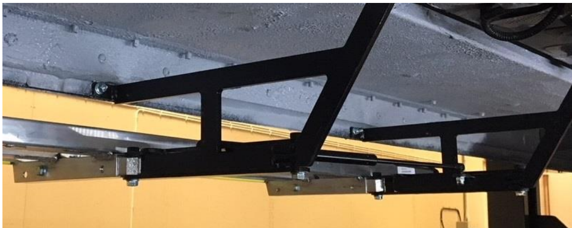
Bild 4. Främre och mittersta konsolen med gasdämpare monterad

Kontrollera samtidigt att det inre fästet ligger väl an mot karossen. Fäst den yttre konsolen i karossens tröskel från utsidan med två stycken rostfria bultar, M6 x 25.