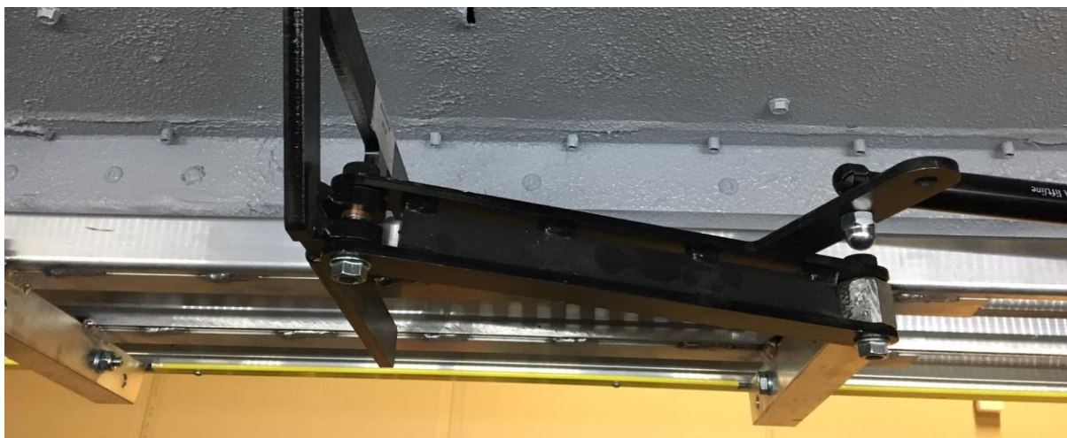
Bild 5. Mellersta konsolen med gasdämpare monterad

Upprepa proceduren med alternativ 1 för resterande konsoler. Endast främre konsolen skall svetsas.