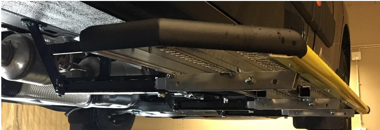
Bild 1. Kompletta fotsteg

Monteringsanvisningen visar montering av fotsteg vid sidoskjutdörr på fordonets högra sida. Rostskydda alla upptagna ytor i karossen.